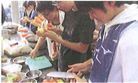
1) 1対1の関係づくり、小集団、数十人の集団という段階的にコミュニケーションが深まるグループワーク「キャンプでの飯盒炊飯」