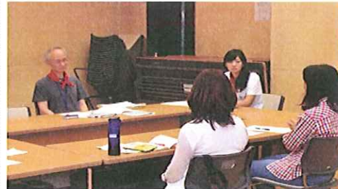
2) 子育てに関する自信回復を目的にした専門家によるグループカウンセリング「親の会」